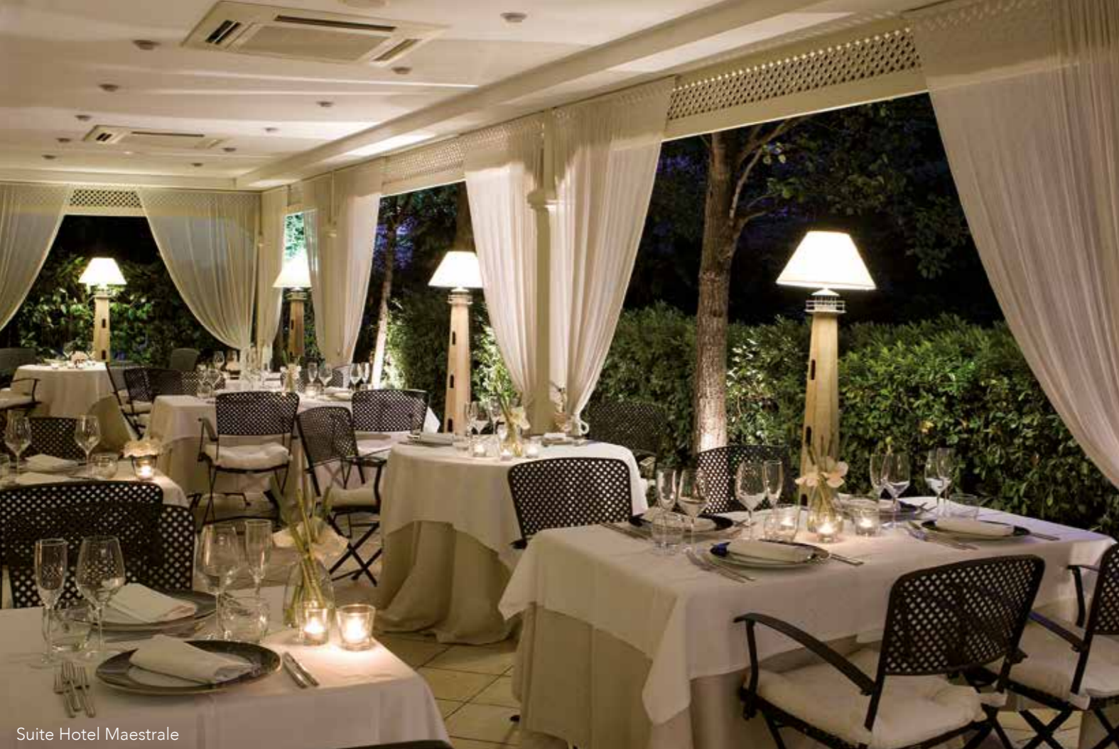
Suite Hotel Maestrale