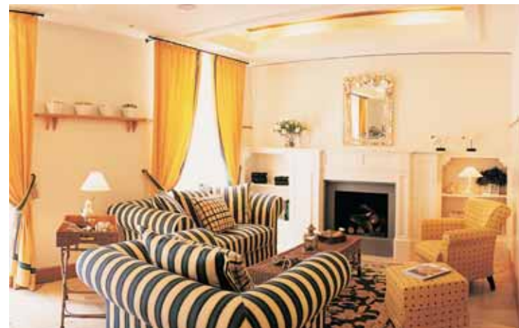
Suite Hotel Maestrale

Sedici stanze e dieci suite arredate con gusto mediterraneo in ogni particolare, fanno del Suite Hotel Maestrale, l'hotel più esclusivo di Riccione.